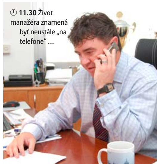
🕒 11.30 Život manažéra znamená byť neustále „na telefóne“ ...