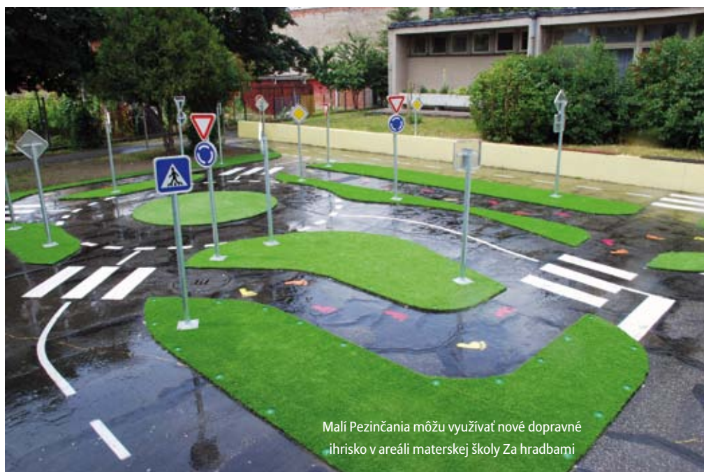
Malí Pezincania môžu využívať nové dopravné ihrisko v areáli materskej školy Za hradbami