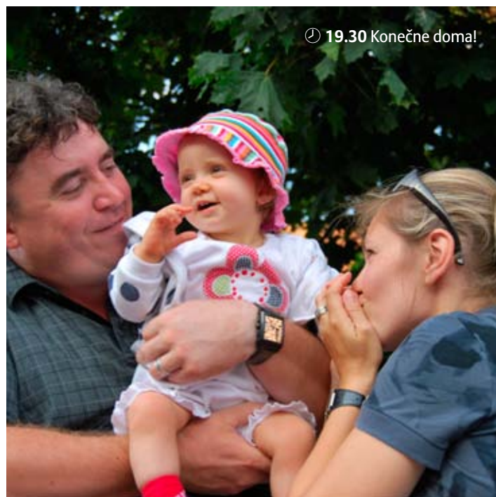
🕒 19.30 Konečne doma!