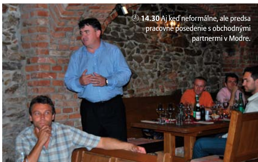
🕒 14.30 Aj keď neformálne, ale predsa pracovné posedenie s obchodnými partnermi v Modre.