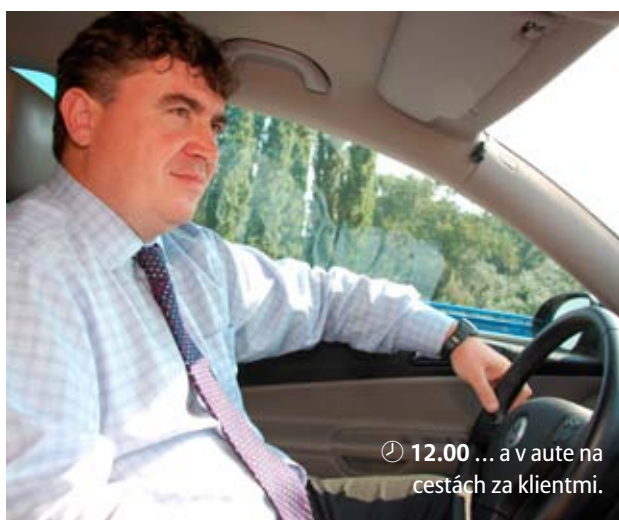
🕒 12.00 ... a v aute na cestách za klientmi.