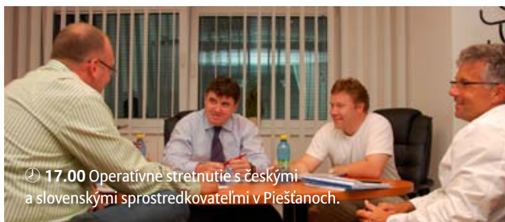
🕒 17.00 Operatívne stretnutie s českými a slovenskými sprostredkovateľmi v Piešťanoch.