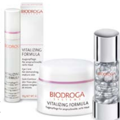
Fotografia je ilustračná, darček sa môže od použitého snímku líšiť

*Cena platí pre jednu osobu. Do žrebovania nebudú zaradení zamestnanci Allianz – SP. O výhre budeme výhercu informovať písomne.