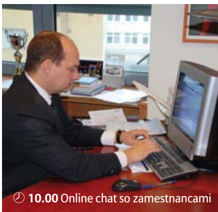
🕒 10.00 Online chat so zamestnancami

Vzdelanie: Vyštudoval Odbor teoretická informatika na Matematicko-fyzikálnej fakulte Univerzity Komenského v Bratislave. Prax: V ASP pôsobí od roku 2001, kedy z pozície externého poradcu zodpovedal za vývoj životných produktov, provízne systémy a bol hlavným manažérom projektu zlučovania IT systémov Allianz a. s. a Slovenskej poisťovne. Než sa stal členom predstavenstva, pôsobil v riadiacich pozíciách odboru stratégie, odboru interného auditu a odboru správy neživotných poistení. V súvislosti so svojim pôsobením vo finančnom biznise hovorí, že je to v prvom rade „people business“: „Oblasť, v ktorej pôsobím, je o ľuďoch. Preto bol pre mňa prvoradým výber tých najlepších ľudí na trhu, s ktorými budem pracovať a myslím, že sa to podarilo. Máme najlepších ľudí a ja sa ich snažím dostatočne motivovať a poskytovať im priestor na ďalší rozvoj. Vďaka ich práci máme najväčšiu dôveru klientov a v našom segmente sme trhovým lídrom.“