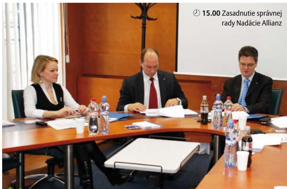
🕒 15.00 Zasadnutie správnej rady Nadácie Allianz