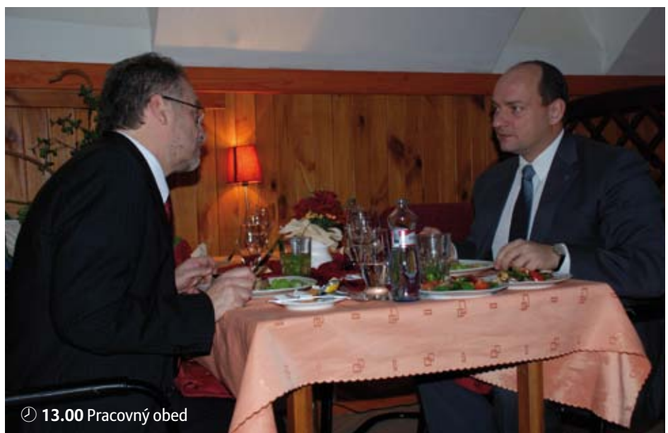
🕒 13.00 Pracovný obed