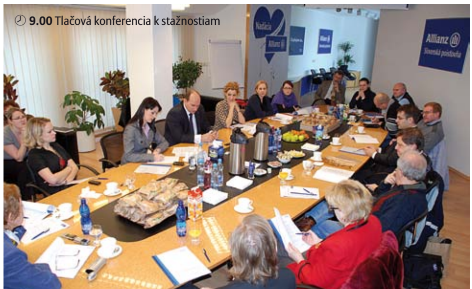
🕒 9.00 Tlačová konferencia k sťažnostiam