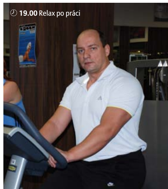
🕒 19.00 Relax po práci