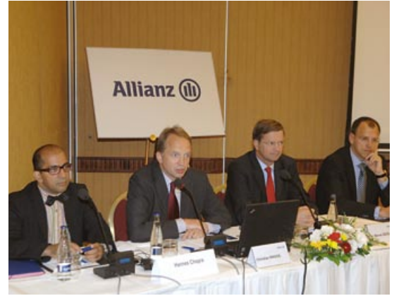
Tlačová konferencia pre slovenských, rakúskych a ruských novinárov