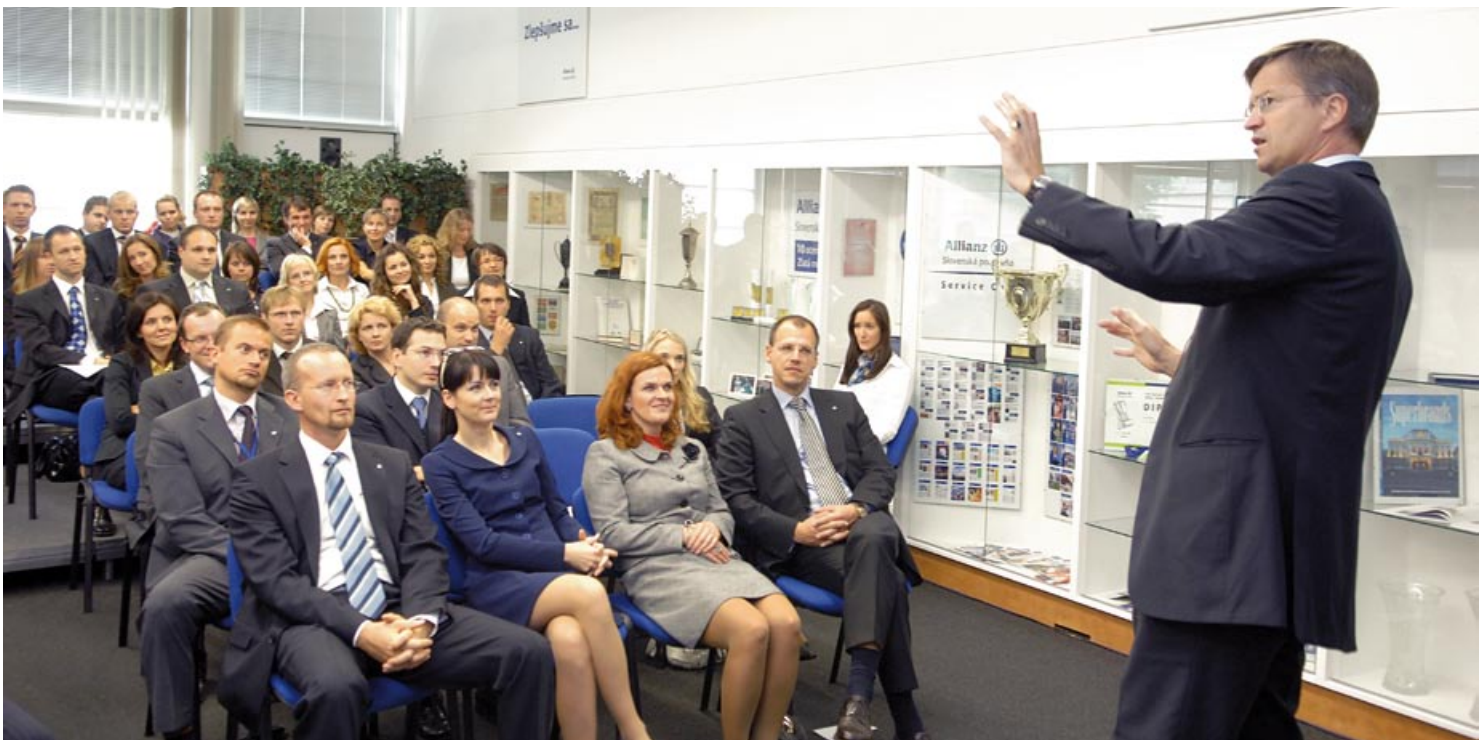
Stretnutie so zamestnancami