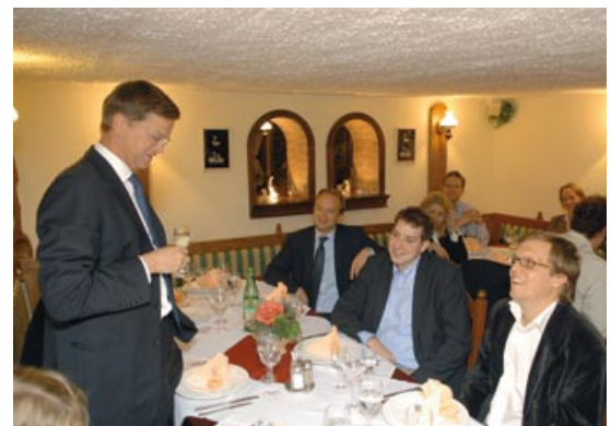
Tradičná husacina v Slovenskom Grobe

finančných skupín sveta. Viac ako polovica predpísaného poistného dnes pochádza z krajín mimo Nemecka. V súčasnosti Allianz Group prostredníctvom dcérskych spoločností, pobočiek a konzorcií poskytuje svoje služby 60 miliónom zákazníkov vo viac ako 70 krajinách sveta, v ktorých zamestnáva takmer 175-tisíc ľudí. Výborné výsledky a kvalitu práce Allianz Group vo svete ocenili aj medzinárodné spoločnosti Standard & Poor's a A. M. Best stabilne vysokým ratingovým hodnotením.