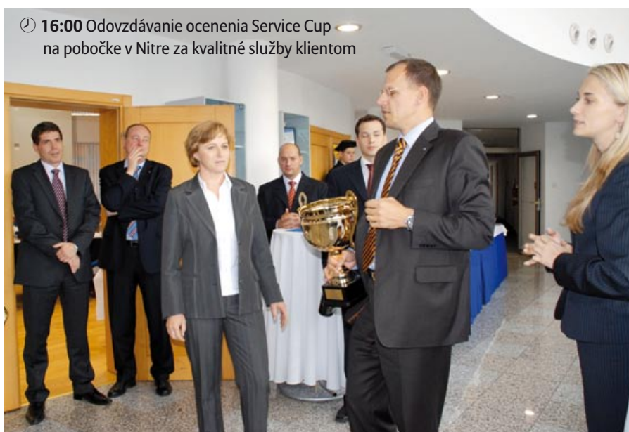
🕒 16:00 Odovzdávanie ocenenia Service Cup na pobočke v Nitre za kvalitné služby klientom