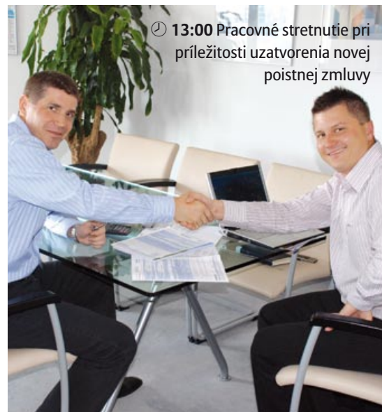
🕒 13:00 Pracovné stretnutie pri príležitosti uzatvorenia novej poisťnej zmluvy