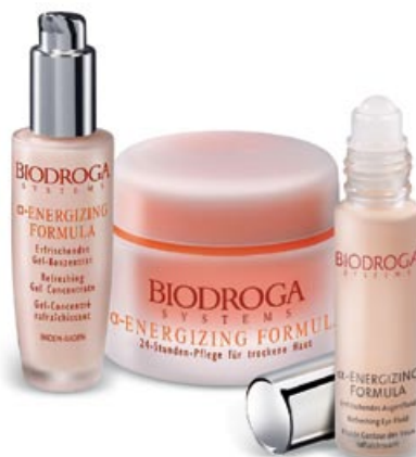
Ilustračná fotografia - Zmena výhy vyhradená.

*Cena platí pre jednu osobu. Do žrebovania nebudú zaradení zamestnanci Allianz – SP. O výhre budeme výhercu informovať písomne.