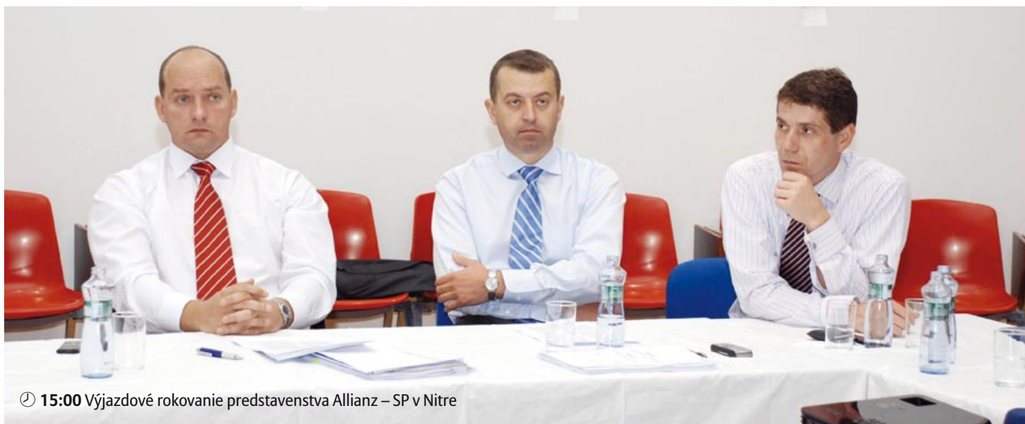
🕒 15:00 Výjazdové rokovanie predstavenstva Allianz – SP v Nitre