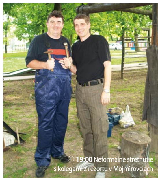
🕒 19:00 Neformálne stretnutie s kolegami z rezortu v Mojmirovciach