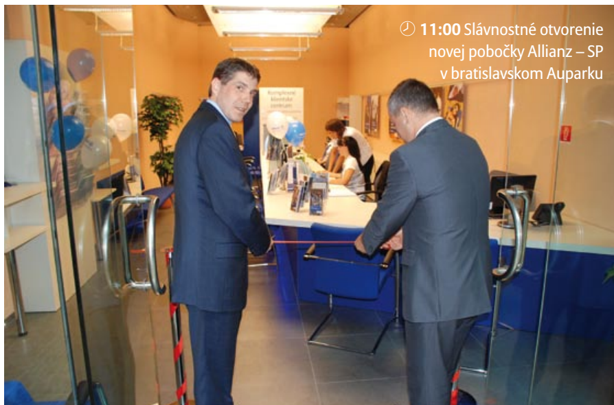
🕒 11:00 Slávnostné otvorenie novej pobočky Allianz – SP v bratislavskom Auparku